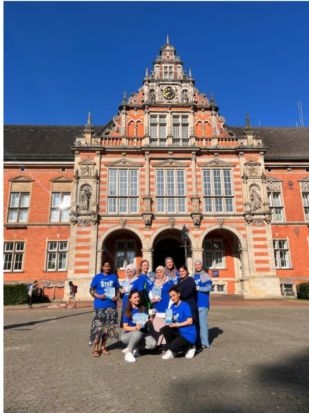
Flyer- Aktion bevor der Ausflug losging. Vor dem Harburger Rathaus Gebäude.